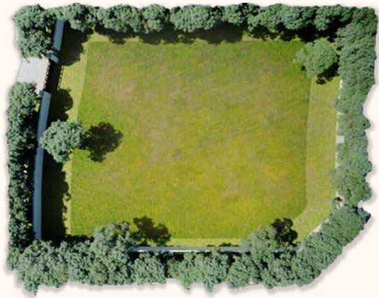
Lote tipo B

Creemos sobre todas las cosas en el valor del orden, es por ello que se han generado un justo y cabal “Reglamento de Condominio” fusionado con un riguroso “Reglamento de Construcción”, creado y supervisado por la desarrolladora del proyecto Índigo Invest y por el despacho de arquitectura de Artigas. Ambos reglamentos tienen el propósito de asegurar todos aquellos aspectos que puedan beneficiar el estilo de vida que nuestros residentes buscan mantener en su vida diaria. El uso de áreas comunes, el respeto por las zonas de estacionamiento, las áreas verdes, el estilo arquitectónico que conserve la