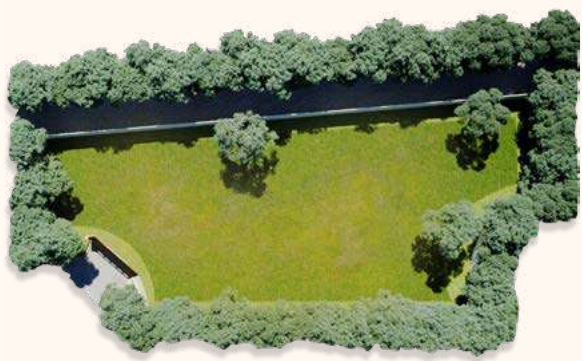
Lote tipo A